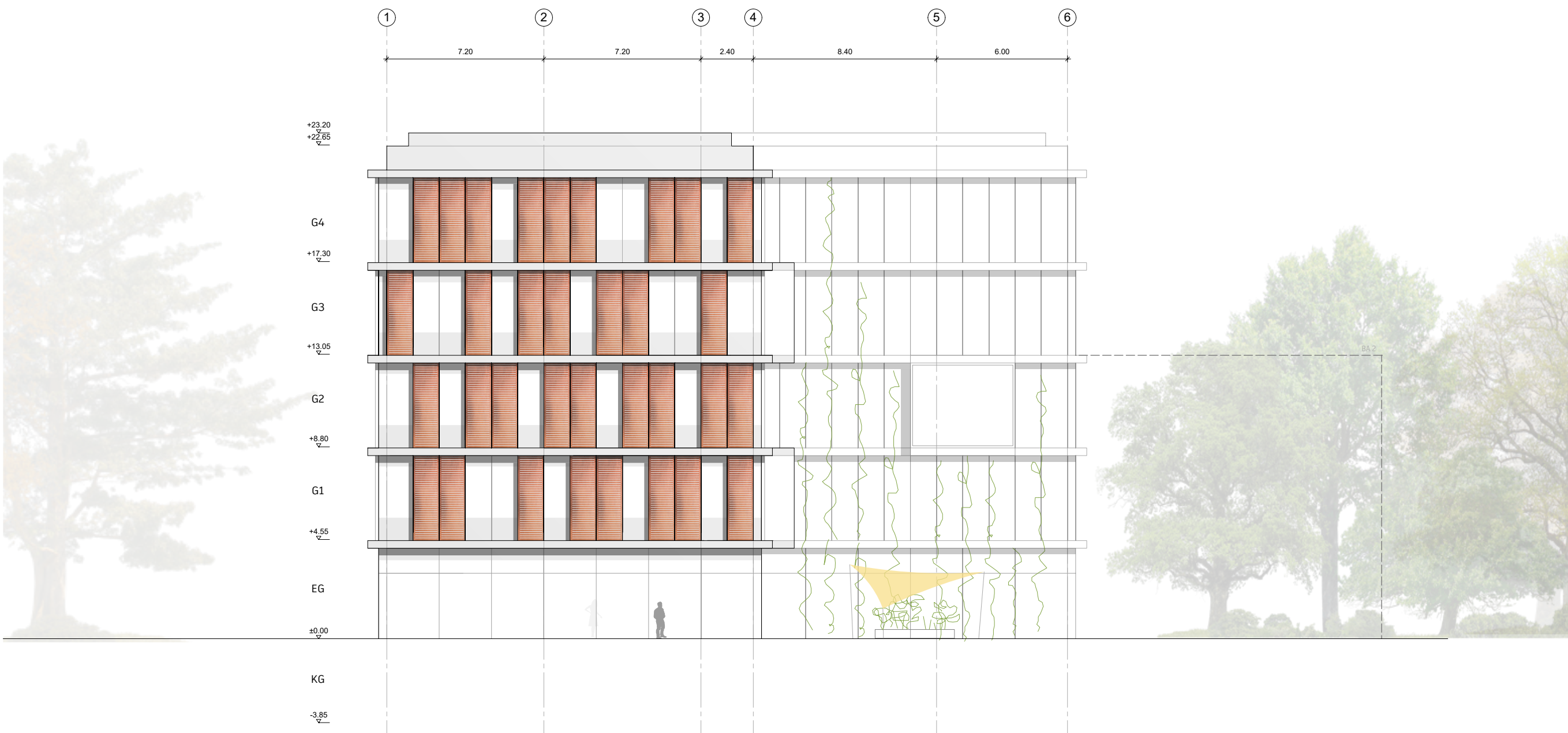
Ansicht Süd M. 1:200